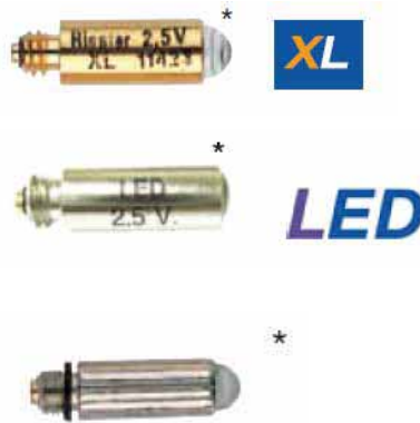
Bombillas de laringoscopio