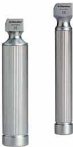
Mangos de laringoscopio